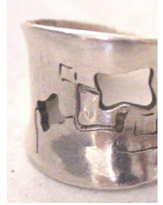
mélange gravure burin et ajours