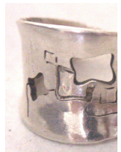
mélange gravure burin et ajours