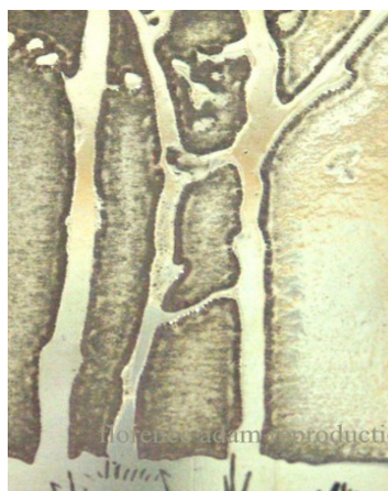
gravure à l'acide

objet. Il le rend agréable à l'oeil et lui donne une identité. Le côté magique réside dans le fait qu'un simple dessin peut rendre un objet beaucoup plus vivant et bien plus reconnaissable !