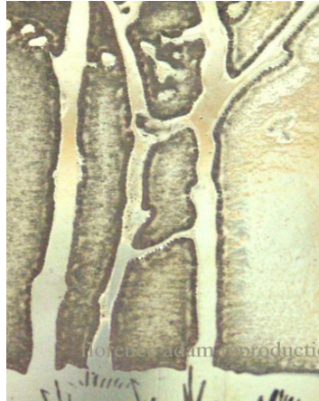
gravure à l'acide

objet. Il le rend agréable à l'oeil et lui donne une identité. Le côté magique réside dans le fait qu'un simple dessin peut rendre un objet beaucoup plus vivant et bien plus reconnaissable !